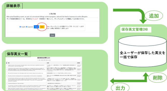
図 3：文章保存機能概要

機能の概要を図 3 に示す。文章保存機能は英単語学習における単語カードを想定している。この機能では、ユーザが検索結果として表示された英文を詳細ポップアップから保存でき、学習者が重要と感じたフレーズを個別に管理・整理することができる。また、保存された英文に対して、日本語の対訳文も併せて保存され、自分が保存した文章は別ページで一覧表示される。