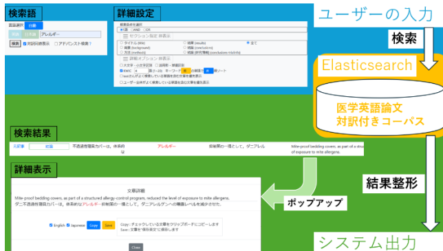
図 2：システムインターフェース

本システムでは、学習者の操作ログを収集し、Learning Analytics に基づいて学習進捗や傾向を把握することを目的としている。