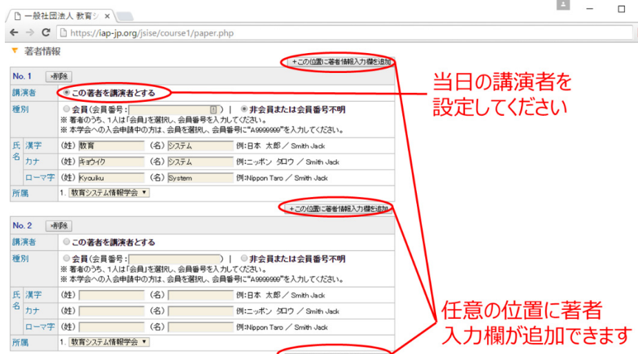
図 5. 著者情報入力ページ