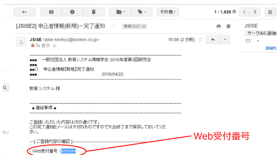
図 3. 申込者登録完了メール

最後に申込者情報を確認していただき、修正がなければ[申込者情報登録実行]をクリックしてください。申込者情報登録完了の連絡と Web 受付番号 が記載されたメールが届きます。これを利用して各種申込ページから講演申込を行うことができます。