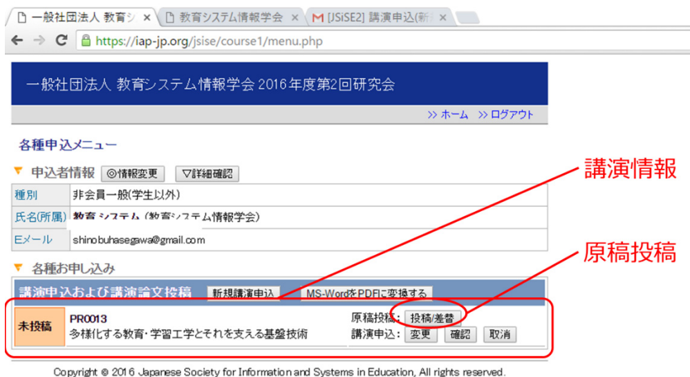
図 6. メニューページ（講演情報登録後）

講演申込後にメニューページにログインすると、講演情報が表示されます。該当する講演の[投稿/差替]ボタンから原稿を投稿してください。また、このページから講演情報の変更や確認、取り消しも行うことができます。