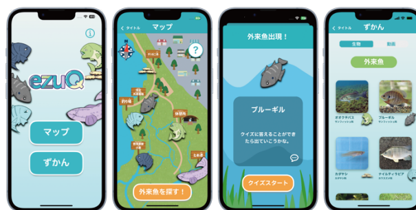
図 1 アプリケーション ezuQ の画面例

本アプリケーションでは、ゲーミフィケーションの要素を取り入れた「クエスト機能」、外来種問題に関する問題を出題する「クイズ機能」、江津湖に生息する生物の生態について説明した「図鑑機能」の 3 つを設けた。図 1 は、アプリケーション ezuQ のスクリーンショットである。左から右に、タイトル画面、クエスト機能の画面、クイズ機能の画面、図鑑機能の画面を示している。