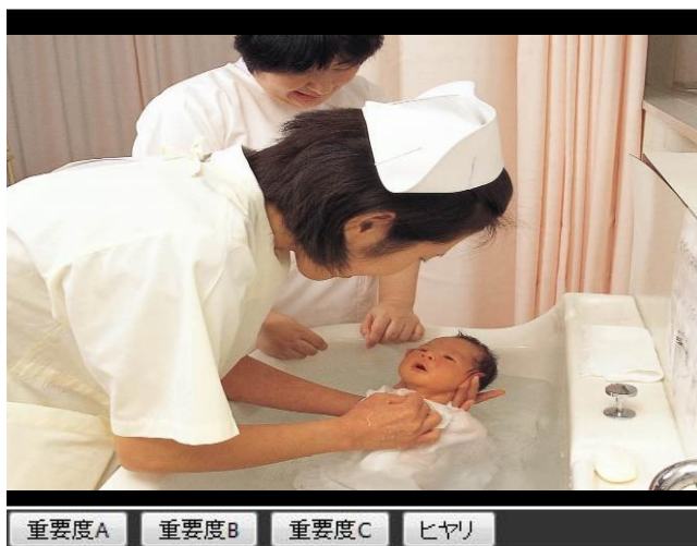
図1 動画視聴の画面

図1は、システムの動画視聴の画面である。学生は、パソコン、または、ケータイのブラウザを利用し、動画教材を視聴して学習する。